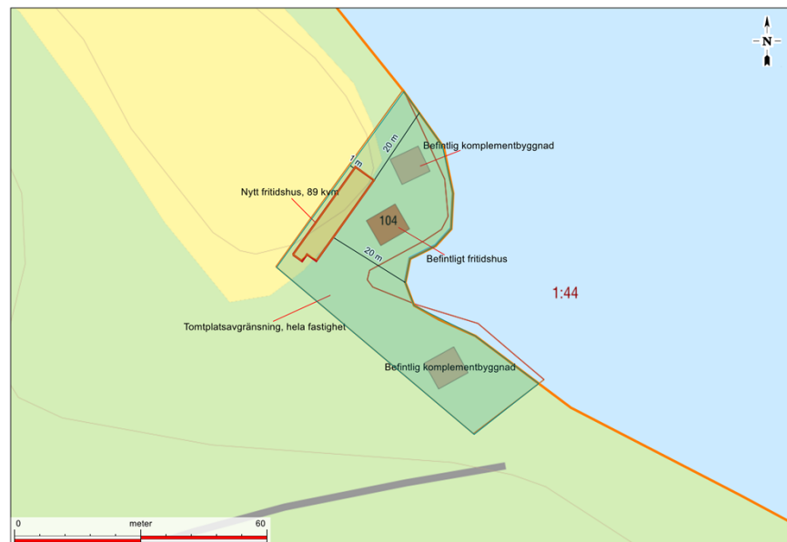
Figur 1, Tomtplatsavgränsning och situationsplan över tänkta åtgärder.

Bygg- och miljöenheten, Lovisa Bertilsson