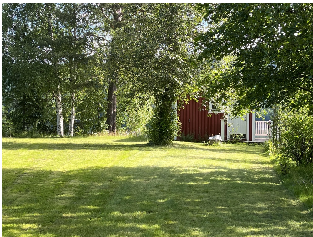
Figur 3, Vy mot vattnet där tänkt nybyggnation är tänkt placeras.