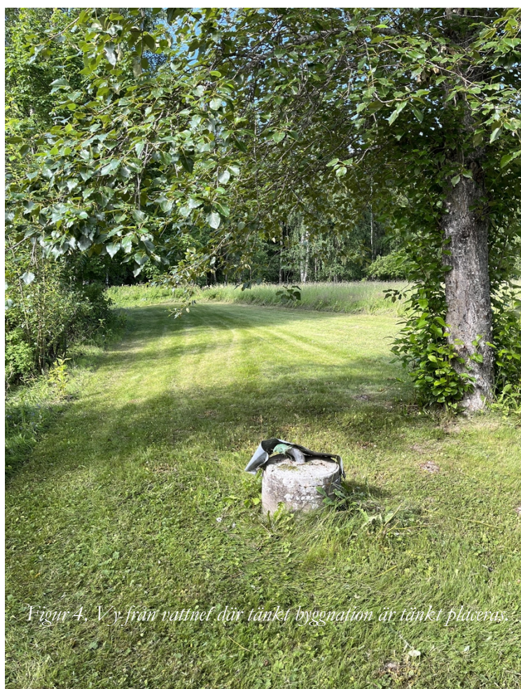
Figur 4, Vy från vattnet där tänkt byggnation är tänkt placeras.